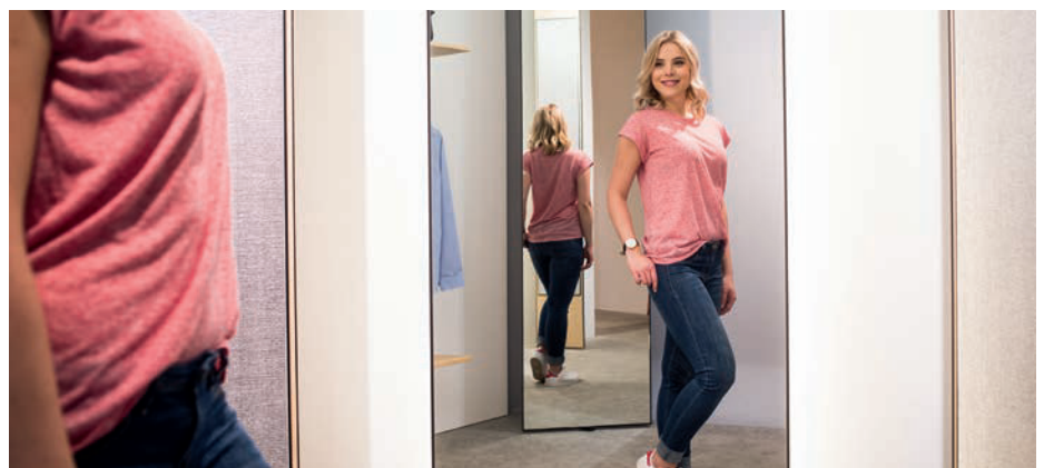
▲ Ansorg-Beleuchtung für Umkleiden / Ansorg lighting for dressing rooms

74.6% of the population try on selected garments in the store ‘frequently’ or even ‘in any case’, 41.4% ‘always’ do. At the same time, 40.2% even leave the store without buying, because the dressing rooms do not appeal to them. While 92.3% of the population considers it ‘important’ to ‘very important’ to check the fit of a piece of clothing in the dressing room, 71.7% are annoyed by poorly designed cabins. 72.7% are (very) annoyed by insufficient lighting in dressing rooms; among women it is even 78.7%. Insufficient light annoys customers even more than not having a second mirror for an all-round view, lack of seating, or not enough space. 85% of all interviewees said that pleasant lighting and a good illumination in a cabin is important to them, in women even over 90%. Generally, good lighting in dressing rooms is more important to women.